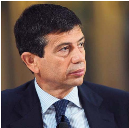
Il ministro delle Infrastrutture e dei Trasporti Maurizio Lupi

In qualunque contratto di trasporto il prezzo e le condizioni sono rimesse all'autonomia delle parti. Il committente però deve fare attenzione al vettore con cui tratta. Perché se questi non è in regola con le contribuzioni retributive, previdenziali e assicurative, in pratica non paga i propri dipendenti e/o i contributi Inps e Inail, il committente stesso diventa corresponsabile di tale irregolarità. Per evitarlo il committente deve verificare la regolarità del vettore, anche facendosi consegnare un'autocertificazione in cui si attesti il versamento delle contribuzioni ricordate. Il committente che non effettui tale verifica o non si faccia consegnare tale autocertificazione, diventa solidalmente responsabile insieme al vettore o a eventuali subvettori, entro i due anni dalla fine del contratto di trasporto. Il vantaggio fornito al committente è che questa solidarietà non è paritetica, in quanto il committente può chiedere che gli ammanchi dei versamenti siano saldati prima dal vettore e dai subvettori. Ciò significa che anche rispetto a un'azione esecutiva il